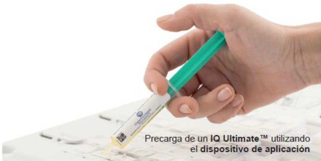
Precarga de un IQ Ultimate™ utilizando el dispositivo de aplicación